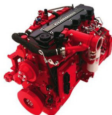
Motor Cummins o Shangchai